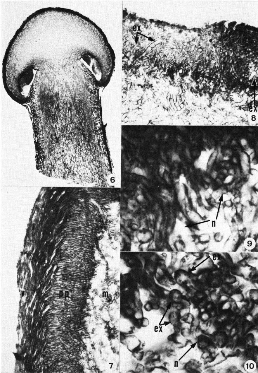
Fig. 6-10. Limacella glioderma . — 6. Coupe médiane d'un stade avancé, \times 16 . — 7. Matrice du voile (m.), piléipellis (p.p.) et voile (v.) dans la partie latérale du pileus d'un stade avancé, \times 330 . — 8. Extrémités libres (ex.) pénétrant de bas en haut dans le piléipellis, \times 330 . — 9. Nodules (n.) qui se dilatent dans un stade avancé par l'inflation de ses éléments, \times 1000 . — 10. Nodule (n.) dans un stade avancé avec plusieurs extrémités libres (ex.) qui en émanent, \times 1000 .