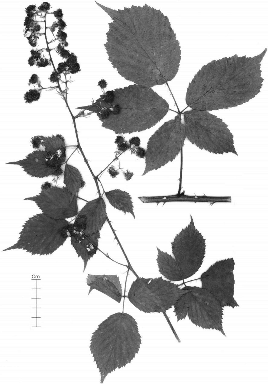
Fig. 2. Rubus beijerinckii Meijer.