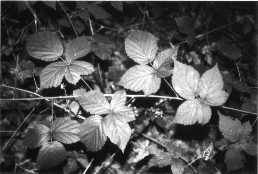
Fig. 7. Rubus surrectus Meijer op de locus typicus bij Noordwolde.

Gelijkende soorten – Binnen het gebied is deze soort alleen te verwarren met R. drenticus Beek & Meijer, die afwijkt door licht roze bloemen en behaarde antheren.