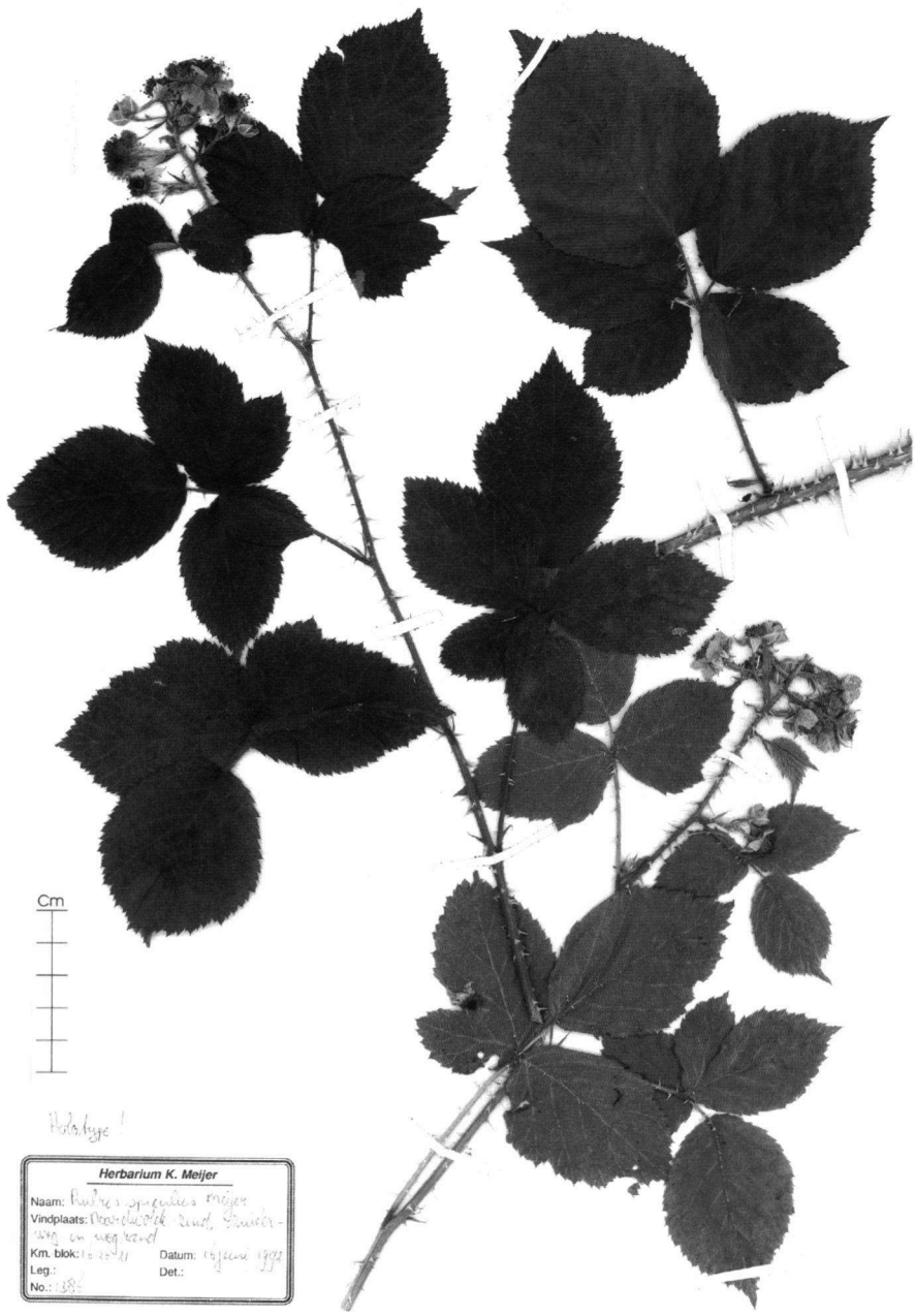
Fig. 10. Rubus spiculus Meijer.