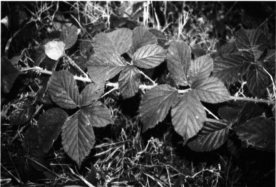
Fig. 9. Rubus spiculus Meijer op de locus typicus bij Noordwolde.

Folia 5-nata supra glabra vel paulo pilosa subtus breviter molliter tractabile pilosa denti-