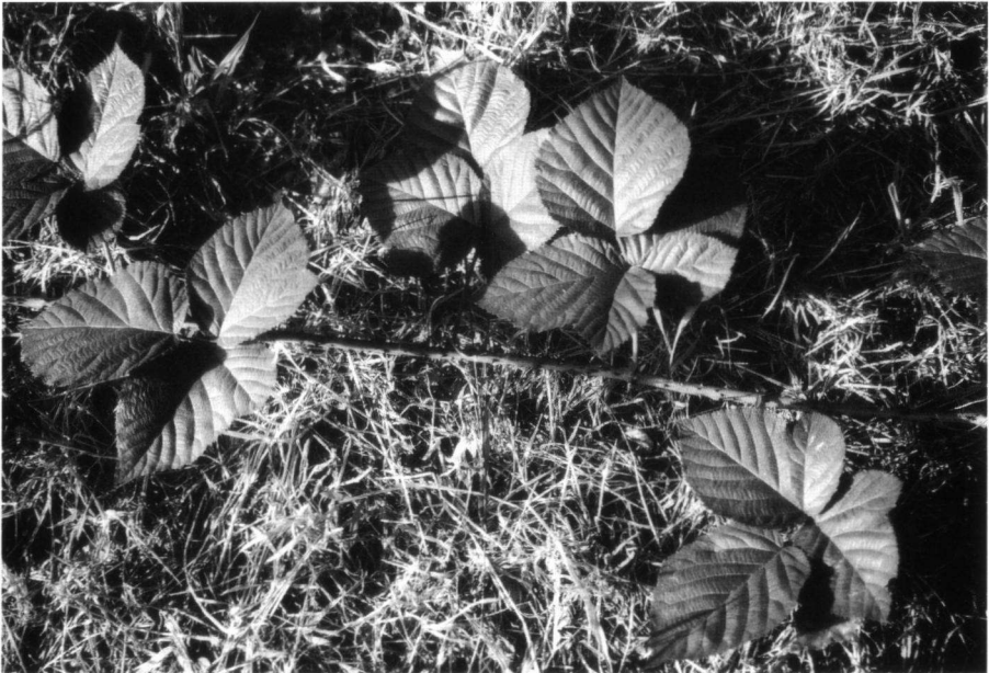
Fig. 3. Rubus coccinatus Meijer op de locus typicus bij Vledderveen.

Differt a R. passionis Beek et Meijer turione paulo piloso pilis (1–)5–20(–25) per internodium aculeis multo inaequalioribus basi latiore usque ad 7(–10) mm longis aperte obscurissime rubris; foliis 3–5-natis, lenius acuminatis; inflorescentia densius armata aculeis longioribus ad 9 mm longis glandulis longioribus; receptaculo dense et longe piloso. Floret exeunte Junio ad Julio.