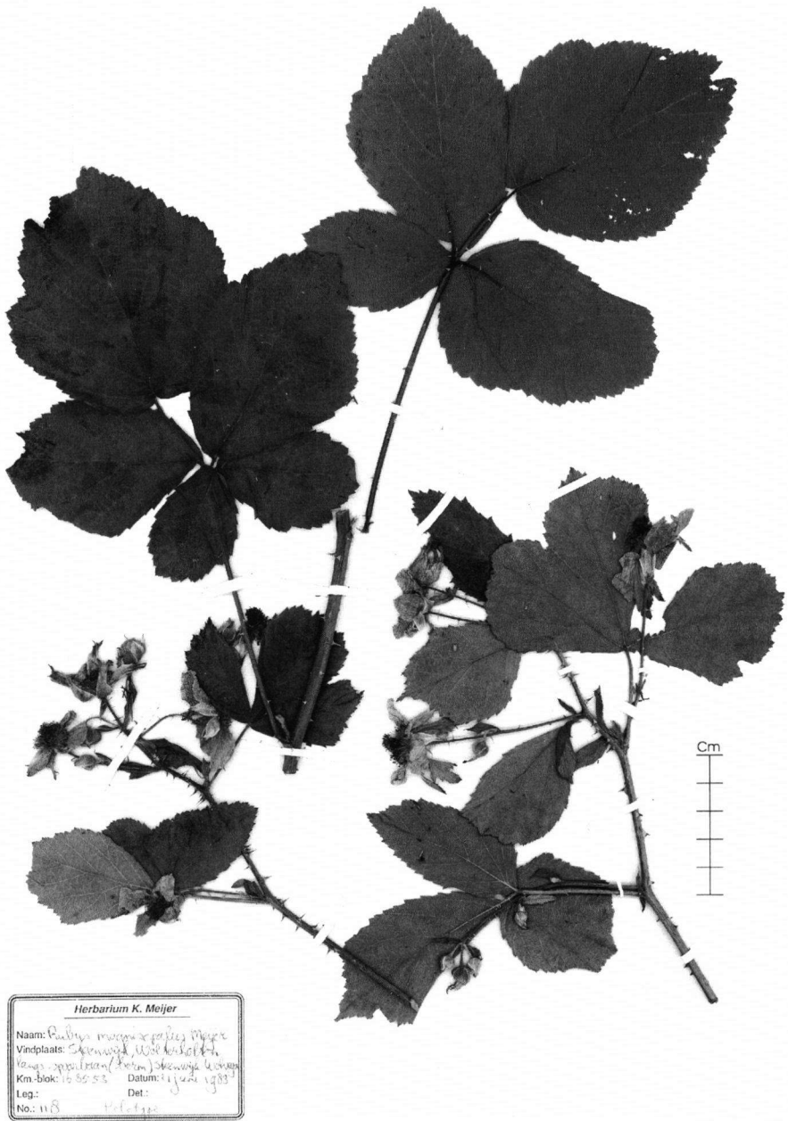
Fig. 5. Rubus magnisepalus Meijer. Foto: B. Kieft.