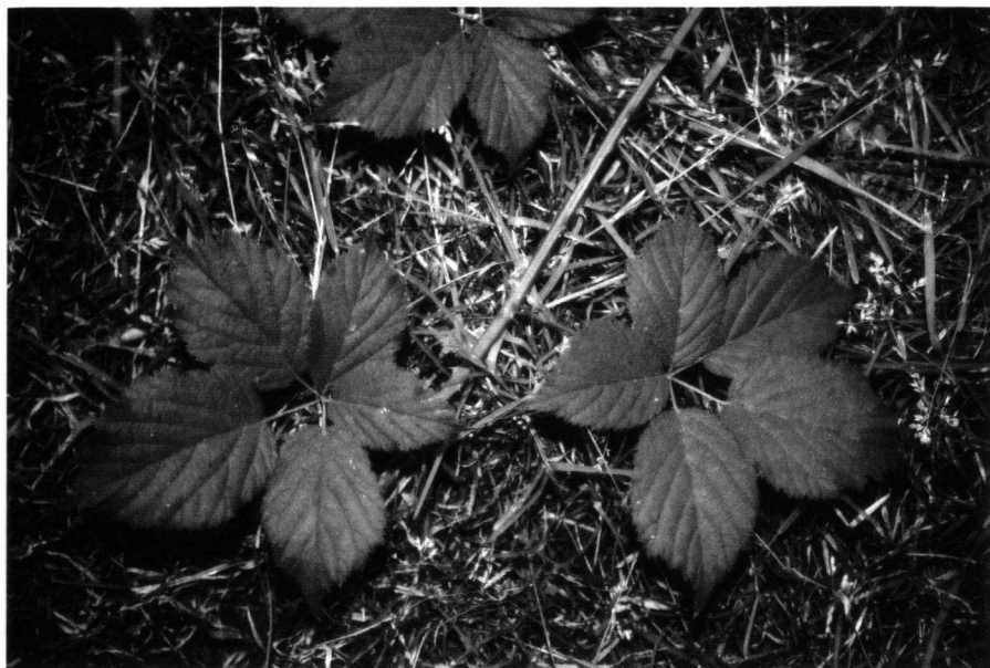
Fig. 1. Rubus beijerinckii Meijer op de locus typicus bij Steenberg.

mm lang. Steunblaadjes lijnvormig, 10–16 mm lang, gewimperd, met korte klieren. Bladsteel 6–9 cm lang, korter tot veel langer dan de onderste zijblaadjes, dun behaard tot kaalwordend, soms met enkele kort gesteelde klieren en met 10–12 gebogen of kromme stekels. Bladen 5-tallig, aan de bovenzijde zwak behaard, aan de onderzijde hoofdzakelijk op de nerven niet of nauwelijks voelbaar behaard. Bladranding (vrij) breed, stomp tot driehoekig, met topspitsjes, matig of vaker diep, soms bijna ingesneden, onduidelijk periodisch gezaagd, met rechte of iets teruggerichte tanden. Topblaadje met uitgerande tot hartvormige voet, 99–140 mm lang, eirond, elliptisch of omgekeerd eirond, geleidelijk in een zeer lange, vrij brede 20–25 mm lange spits versmald; breedte 57–67(–93)% van de lengte; lengte van het steeltje 27–40% van de lengte van het blaadje.