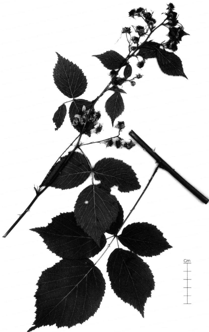
Fig. 8. Rubus surrectus Meijer.