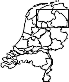
Gedeelte van Nederland weergegeven in de verspreidingskaartjes