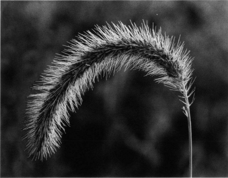
Fig. 1. De knikkende bloeiwijze van Setaria faberi Herrm.

De planten bloeien in de tweede helft van augustus tot eind oktober. De rijpe aartjes vallen in de loop van oktober in hun geheel uit de bloeiwijze, de fertiele bloem is dus met een pincet niet afzonderlijk uit het aartje te halen (een verschil met S. italica ); dit lukt alleen met scalpels. De rijpe aren verliezen hun aartjes terwijl de borstel'haren' blijven zitten, waardoor de aren steeds meer gaan lijken op borstels voor het reinigen van reageerbuizen. In 2000, in Boxmeer, droegen veel planten eind oktober, begin november nog jong blad en jonge aren. Ze oogden opvallend fris in vergelijking met andere Setaria -soorten.