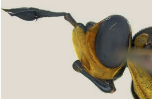
Figuur 2. Kop, zij-aanzicht. Figure 2. Head, lateral view.