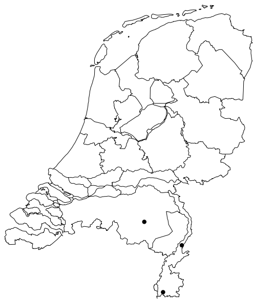
Figuur 4. Vindplaatsen in Nederland. Figure 4. Sightings in the Netherlands.

bijen Macropis Panzer 1809. Op beide Limburgse vindplaatsen werd tevens de wapenvlieg Stratiomys potamida Meigen, 1822 verzameld. Deze staat bekend als kwelindicerend (Brugge 2002).