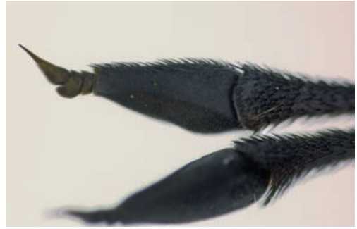
Figuur 3. Derde antennelid. Figure 3. Third antennal segment.

worden met A. capitatum . Bij Leopoldius is de tong altijd korter dan de kop en steekt niet voorbij de mondrand. Door sommigen wordt A. capitatum in het genus Leopoldius geplaatst. Dit is echter een oude opvatting (pers. med. J-H. Stuke), die hier niet gevolgd wordt.