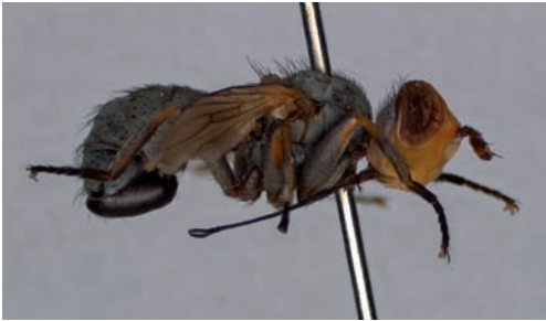
Figuur 2. Zodion cinereum , lateraal. Figure 2. Zodion cinereum , lateral.