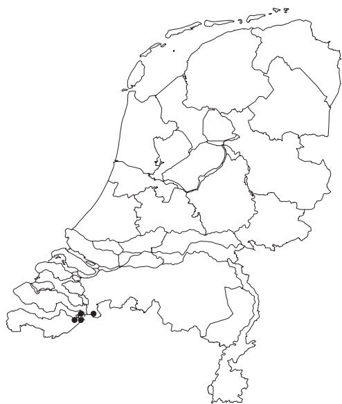
Figuur 9. Vindplaatsen van Zodion kroeberi in Nederland.