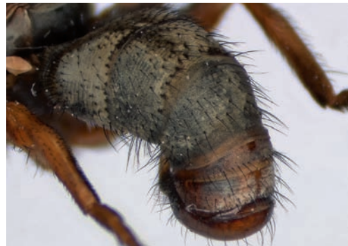
Figuur 8. Zodion kroeberi , tergiet 2-4. Figure 8. Zodion kroeberi , tergite 2-4.

gemeld uit Duitsland en Spanje (Carles-Tolrá & Lencina 2010, Stuke et al. 2006). Zodion kroeberi wordt overal als zeldzaam beschouwd.