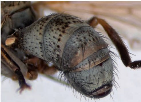
Figuur 7. Zodion cinereum , tergiet 2-4. Figure 7. Zodion cinereum , tergite 2-4.