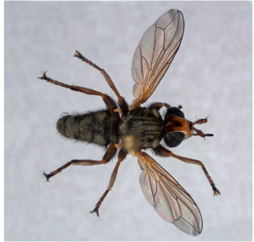
Figuur 3. Zodion kroeberi , dorsaal. Figure 3. Zodion kroeberi , dorsaal.