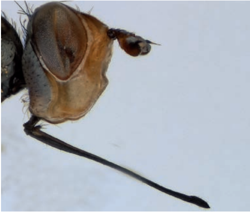
Figuur 5. Zodion cinereum , kop in zijaanzicht. Figure 5. Zodion cinereum , head in lateral view.