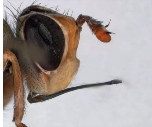
Figuur 6. Zodion kroeberi , kop in zijaanzicht. Figure 6. Zodion kroeberi , head in lateral view.