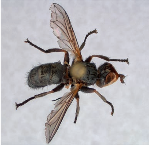
Figuur 1. Zodion cinereum , dorsaal. Foto's John Smit. Figure 1. Zodion cinereum , dorsaal. Photos John Smit.