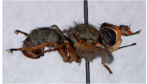
Figuur 4. Zodion kroeberi , lateraal. Figure 4. Zodion kroeberi , lateral.