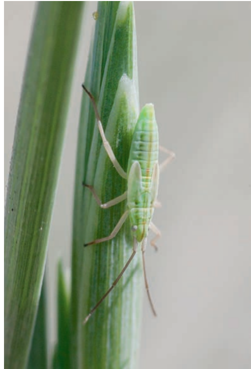
Figuur 3. Trigonotylus psammaecolor , nimf.

Camping Seedune, AC 206-611, 4.VI.2011, 4 ♂, 1 ♀ van spar, DH. Bekend van de Oost- en Noord-Friese eilanden (Bröring et al. 1993).