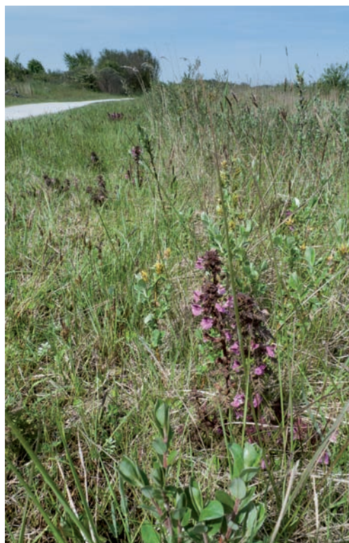
Figuur 2. Vindplaats van Pachycoleus pusillimus op

Schiermonnikoog.