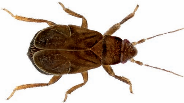
Figuur 1. Pachycoleus pusillimus , vrouwtje.

In onderstaand overzicht zijn details te vinden van de nieuw op de waddeneilanden waargenomen soorten. Volledige gegevens worden alleen opgegeven voor de eerste vondst op het desbetreffende eiland; van de overige vondsten worden alleen de Amersfoortcoördinaten (AC) gegeven. De volgorde en nomenclatuur van de taxa zijn gebaseerd op de 'Catalogue of the Heteroptera of the Palaearctic Region' (Aukema & Rieger 1995, 1996, 1999, 2001, 2006). Tenzij anders tussen haakjes vermeld bevindt het materiaal zich in de collectie van de verzamelaar.