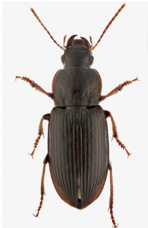
Figuur 1. Harpalus signaticornis, mannetje. Waageningen.