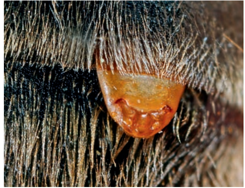
Figuur 3. Kopborststuk van een vrouwtje van Stylops melittae tussen de tergieten van Andrena nitida . Figure 3. Cephalothorax of a female Stylops melittae , protruding between the tergites of Andrena nitida .

achterlijf van de gastheer (fig. 2). Alleen het kopborststuk, dat een stevig uitwendig skelet heeft, wordt tussen de achterlijfssegmenten van de gastheer naar buiten gestoken (fig. 3). De mannetjes zien er wel uit als een volwassen insect. Zij hebben twee functionele achtervleugels die er waaivormig uitzien. Hier ontlene ze hun Nederlandse naam aan. De voorvleugels zijn gereduceerd tot een soort halters. De mannetjes hebben sterk vertakte antennes (fig. 4). Hierop zitten chemoreceptoren waarmee ze de feromonen van de vrouwtjes kunnen waarnemen.