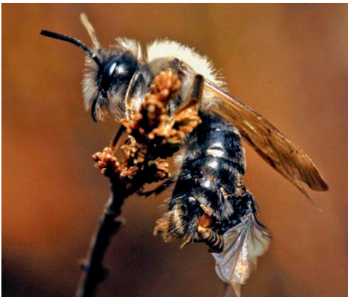
Figuur 7. Copulatie van Stylops melittae .