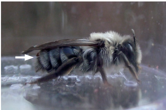
Figuur 1. Andrena vaga , vrouwtje, met vrouwtje van Stylops melittae in het achterlijf. Het kopborststuk is aangegeven met een pijl.

Het grootste deel van het leven van een Stylops speelt zich af in het lichaam van een gastheer, een zandbij. De mannetjes en vrouwtjes van S. melittae vertonen, net als andere waaier- vleugeligen, een sterke seksuele dimorfie. De vrouwtjes zien er meer uit als een larve dan als een volwassen insect. Het grootste deel van het lichaam bevindt zich in het