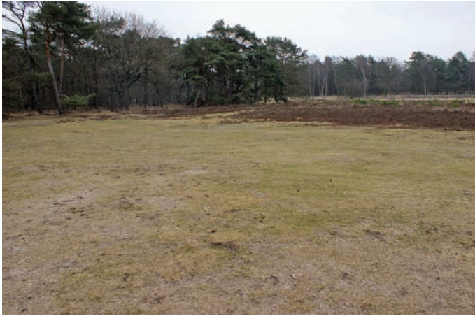
Figuur 8. Het terrein met de kolonie van Andrena vaga .