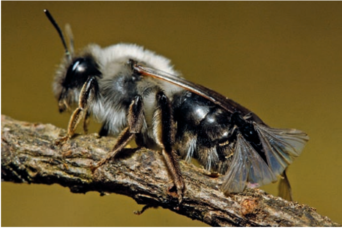
Figuur 6. Andrena vaga -vrouwetje met mannetje Stylops melittae .