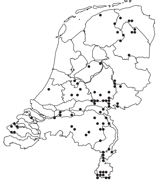
Figuur 5. Verspreiding van Stylops melittae in Nederland.

Violet Middelman organiseerde op 3 maart 2012 een waaiertjesexcursie voor de vlinderwerkgroep IVN Eemland, waar ook de tweede auteur aan deelnam. De excursie overtrof de stoutste verwachtingen. Het stukje grasveld en aangrenzende