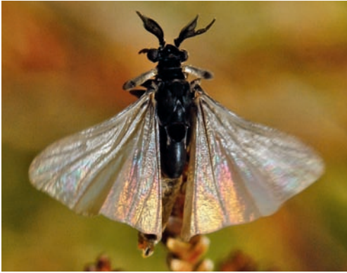
Figuur 4. Mannetje van Stylops melittae .