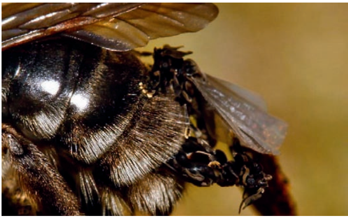
Figuur 9. Mannetje Stylops melittae uitsluitend uit het achterlijf van Andrena vaga , met nog een tweede man op de achtergrond.

Figure 8. The area with the colony of Andrena vaga .