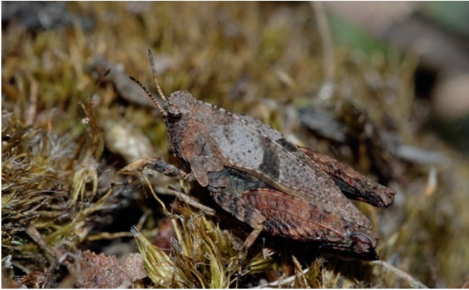
Figuur 2. Bosdoortje Tetrix bipunctata . Foto Kees van Bochove. Figure 2. Tetrix bipunctata . Photo Kees van Bochove.