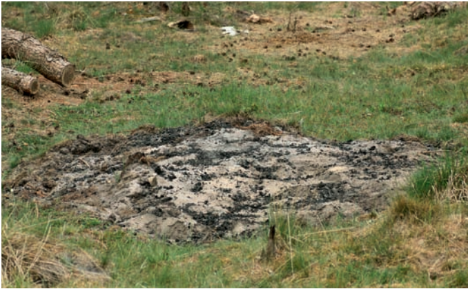
Figuur 3. Vindplaats van Tetrix bipunctata op de Hoge Veluwe. Figure 3. Locality where Tetrix bipunctata was found on the Hoge Veluwe.

gevonden wordt op of in de nabijheid van de brandplek in de lage vegetatie. Op andere plekken in de omgeving werd de soort wel gezocht maar niet aangetroffen.