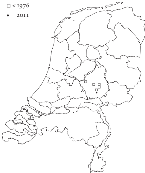
Figure 4. Dutch records of Tetrix bipunctata . Figuur 4. Nederlandse vondsten van Tetrix bipunctata .

gegevens bekend (Kleukers et al. 1997). In 2011 is de vindplaats door veel mensen bezocht en dit geeft een gedetailleerder beeld van de fenologie in ons land. Uit figuur 5 blijkt dat het bosdoortje in 2011 vanaf 5 mei tot 5 augustus vrijwel doorlopend gevonden wordt. In het voorjaar liggen de aantallen duidelijker hoger. Dit zal naar verwachting reëel zijn en niet helemaal verklaard kunnen worden door de grotere inventarisatie-inspanning in het voorjaar. Vroeger werd het bosdoortje ook in april en september gevonden (Kleukers et al. 1997), zodat duidelijk is dat de soort gedurende het gehele seizoen actief is.