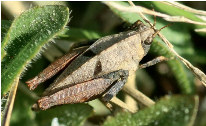
Figuur 1. Bosdoortje Tetrix bipunctata . Figure 1. Tetrix bipunctata .

warm microklimaat heerst. Het bosdoortje werd gevonden op en in de omgeving van een kleine brandplek (fig. 3). Om de brandplek heen is een lage graslandvegetatie aanwezig van de associatie Galio hercynici-Festucetum ovinae , met soorten als bochtige smele Deschampsia flexuosa , liggend walstro Galium saxatile en hondsviooltje Viola canina (Weeda et al. 2002). De graslandvegetatie is niet gesloten, omdat de grond op meerdere plaatsen is omgewoeld door wilde zwijnen. De brandplek die het centrum van de vindplaats vormt, is iets lager gelegen dan de omringende vegetatie, waardoor het warme microklimaat op die plaats nog versterkt wordt. De vegetatie is over het algemeen lager dan 10 centimeter. Aan de randen van de vindplaats gaat de vegetatie deels over in een kleine kapvlakte met naaldhoutstrooisel en deels in een hogere, gesloten graslandvegetatie. Opvallend is dat het bosdoortje alleen