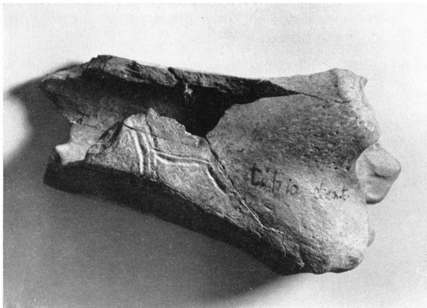
ABBILDUNG 1. Tibia von Cervus teguliensis DUBOIS.