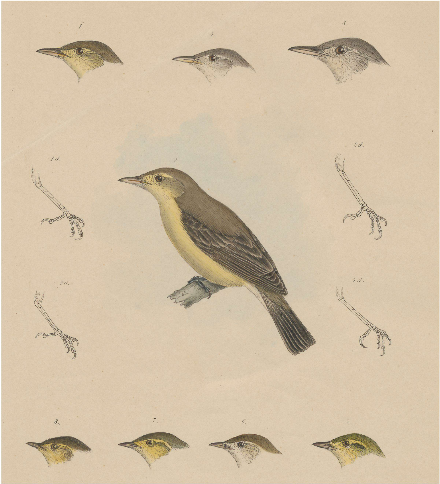
I. FICEDULA HYPOLAIS. II. F. POLYGLOTTA. III. F. OLIVETORUM. IV. F. ELAEICA. V. F.]