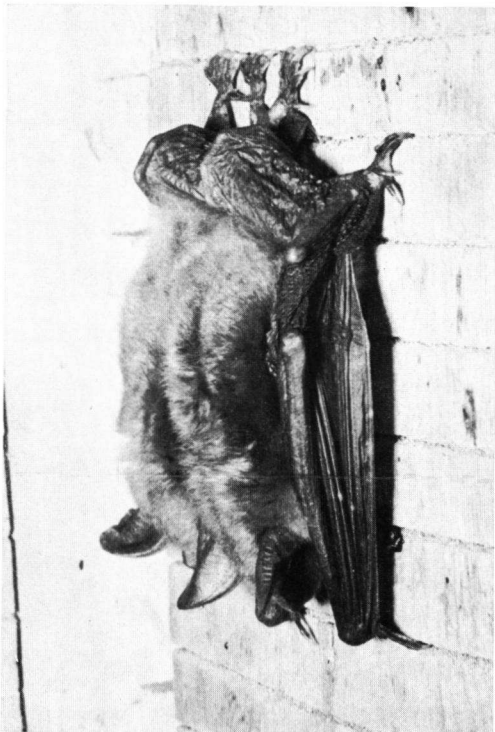
Abb. 2. Zwei Weibchen von Myotis myotis in typischer Stellung unmittelbar vor der Geburt.