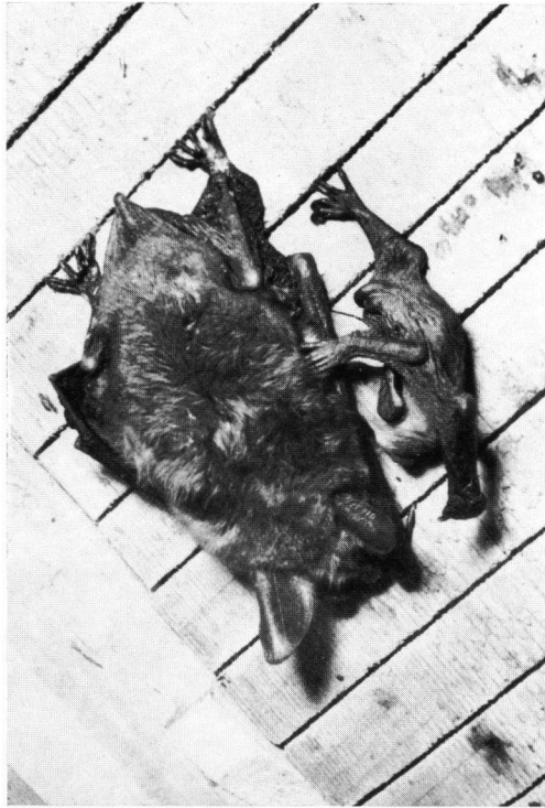
Abb. 4. Myotis myotis — Weibchen mit an der Nabelschnur zerrendem Jungen, wobei dieses dauernd die Brustzitze im Maul behält.