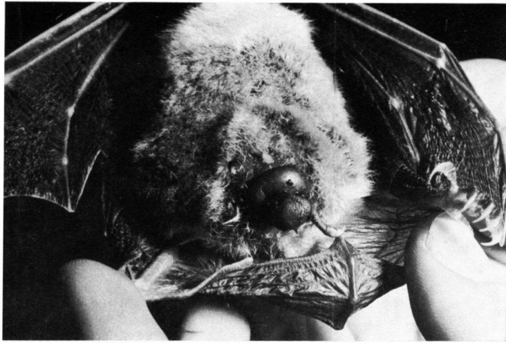
Abb. 1. Myotis myotis — Weibchen zu Beginn des Geburtsvorganges.