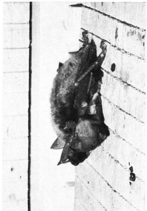
Abb. 3. Myotis myotis — Weibchen mit Jungem bei der Suche nach der Brustzitze. Die Nabelschnur ist hierbei gespannt.