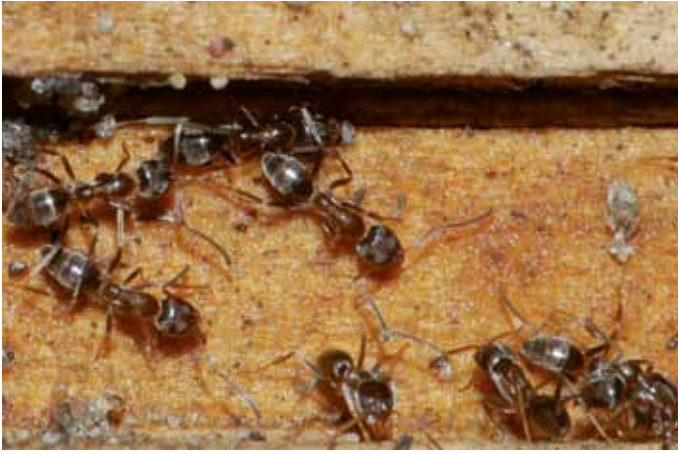
Figuur 4. Werksters op een houten muur aan de buitenkant van een huis, in februari 2008. Capelle aan den IJssel.