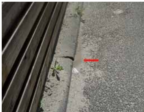
Figuur 2. Habitat van de Argentijnse mier in Capelle aan den IJssel.

Figure 2. The habitat of the Argentine ant in Capelle aan den IJssel.