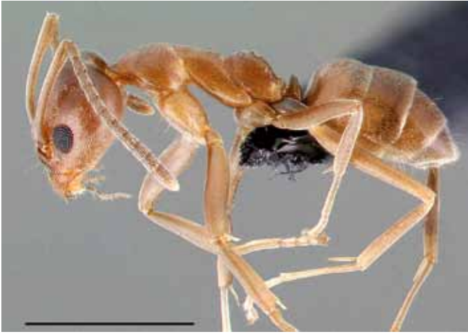
Figuur 1. De werksters van de Argentijnse mier zijn 2,2-2,6 mm lang, bruin, glad, glanzend en zonder staande haren op de bovenkant van de kop en het borststuk.