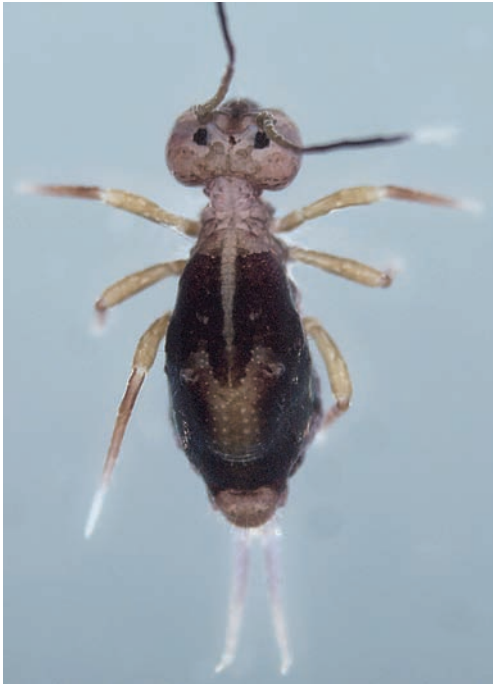
Figuur 1. Ptenothrix ciliata , adult (Ooy, Gelderland, 12.x.2007), bovenaanzicht.

In een recent artikel werd het springstaartengenus Ptenothrix besproken, met een nieuwe soort voor de Nederlandse fauna: P. atra . Na toezending van het artikel aan de Belgische springstaartenspecialist Frans Janssens kwam er een mailtje retour met de opmerking dat op de foto's P. ciliata te zien is en niet P. atra ! De lichte tekening op de rugzijde is (binnen Europa) uniek voor P. ciliata en is afwezig bij P. atra . Nadere bestudering van exemplaren van verschillende vindplaatsen in Nederland en gebruik makend van recent gepubliceerde kenmerken bevestigden dat P. ciliata en niet P. atra voorkomt in Nederland. Dit artikel introduceert P. ciliata , met tekeningen van nieuwe determinatiekenmerken en geeft een rectificatie op het eerder verschenen artikel over het genus Ptenothrix in Nederland.