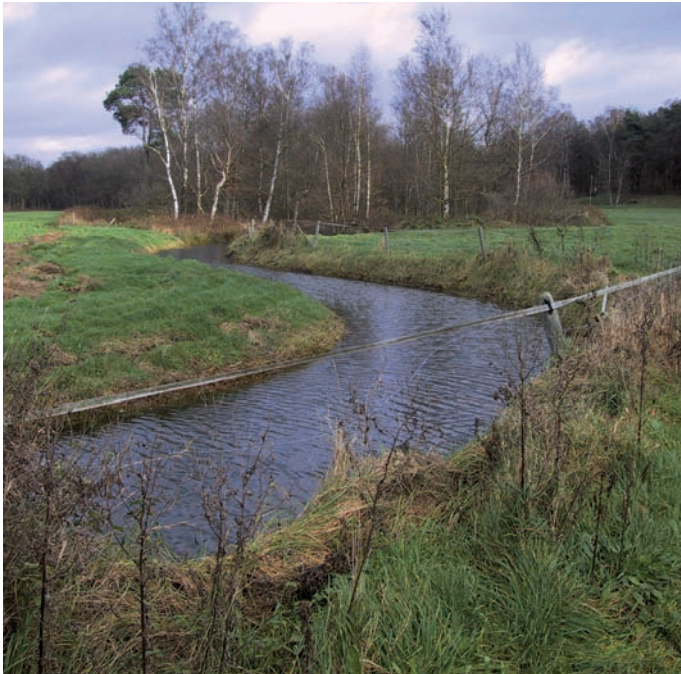
Figuur 3. Heelsumse Beek 'Kabeljauw' vindplaats van P. schlienzi , op 6 december 2006. Figure 3. Heelsumse Beek 'Kabeljauw', where larvae of P. schlienzi were collected on 6 December 2006.

uitgevoerd aan de kop. Hierbij is de LFP de lengte van het frontaalapotoom, gemeten vanaf de achterrand van het kopkapsel tot aan de interantennale groeve. Deze interantennale groeve is een bij het genus Psectrocladius eenvoudige waarneembare structuur aan de voorkant van de kop, gelegen tussen de beide antennen. Het aantal doortjes op de pre-anale borsteldrager is niet altijd vast te stellen; ze zijn erg klein.