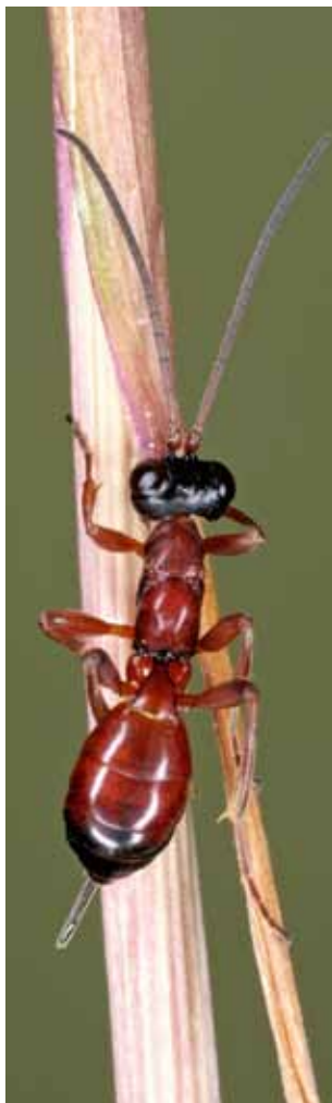
▲ Gelis meigenii