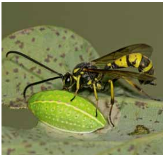
▶▶ Hyposoter carbonarius

voedsel op en kan de gastheer normaal verder leven en groeien. Tot de gastheer groot genoeg is en de sluipwesplarve in enkele dagen de gastheer leeg zuigt ('de grote slurp'). Zo gaat het bijvoorbeeld bij ectoparasitoïden op spinnen die als jonge larve op de spin overwinteren en deze ten slotte in twee dagen leeg zuigen. Bij vele endoparasitoïden van rupsen gaat het ook zo, waarbij de ontwikkeling van de sluipwesplarve pas begint als de rups verpopt is. Voor sterk gespecialiseerde soorten geldt dat ze meestal maar één generatie per jaar produceren.