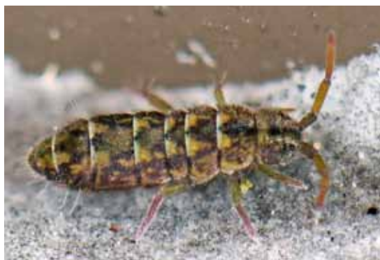
◀ Isotomurus maculatus