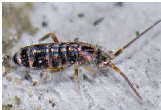
◀ Tomocerus vulgaris

pakketje op een steeltje) op de bodem af, waarna het vrouwtje deze opneemt. Spermatofoorproductie staat onder invloed van geurstoffen uitgescheiden door het vrouwtje (VERHOEF 1984). Sommige soorten vertonen baltsgedrag, waarbij het mannetje het vrouwtje naar de spermatofoor leidt. Bij soorten uit de familie Sminthuridae dragen de vrouwtjes de veel kleinere mannetje met hun antennes. De eieren worden in hoopjes afgezet in de bodem. Na het uitkomen vervellen de dieren continu, ook in het volwassen stadium. Na elke vervelling wisselt een reproductieve fase af met een eefase, althans in het adulte stadium. Sommige soorten zijn altijd parthenogenetisch, waarbij uit onbevuchte eieren alleen dochters voortkomen. Bij enkele soorten komt parthenogenese slechts onder bepaalde omstandigheden voor. Parthenogenese wordt bij veel soorten veroorzaakt door een Wolbachia -bacterie. Springstaarten leven gemiddeld iets minder dan een jaar, maar ze kunnen in het laboratorium wel tot 5,5 jaar oud worden (ERNSTING ET AL. 1993).