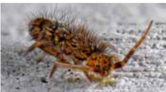
Springstaarten - Collembola

twijfel ontstaan over de monofylie van de Hexapoda, maar modern moleculair onderzoek naar nucleaire genen, onder andere in Nederland, heeft aangetoond dat Hexapoda wel degelijk monofyletisch zijn (TIMMERMANS ET AL. 2008, REGIER ET AL. 2010).