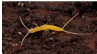
Tweestaarten - Diplura