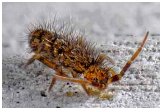
◀◀ Orchesella villosa