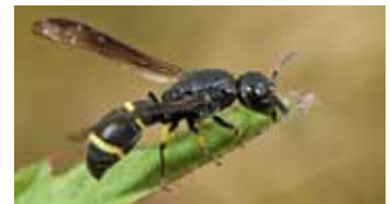
Insecten - Insecta

Animalia ► Arthropoda (fylum) ► Pancrustacea (subfylum) ► Hexapoda (klasse) ► Collembola (subklasse)