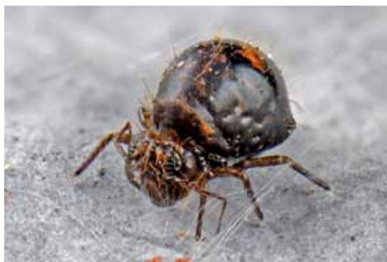
◀◀ Allacma fusca