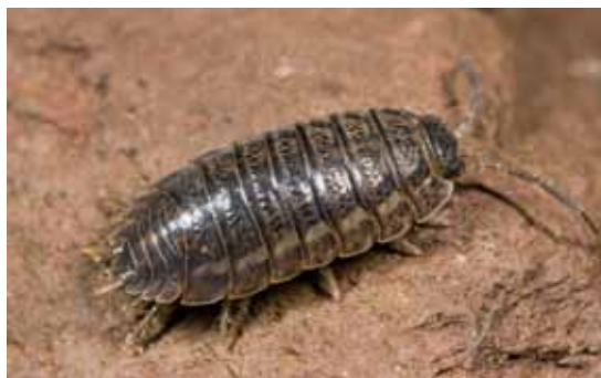
◀◀ Idotea pelagica