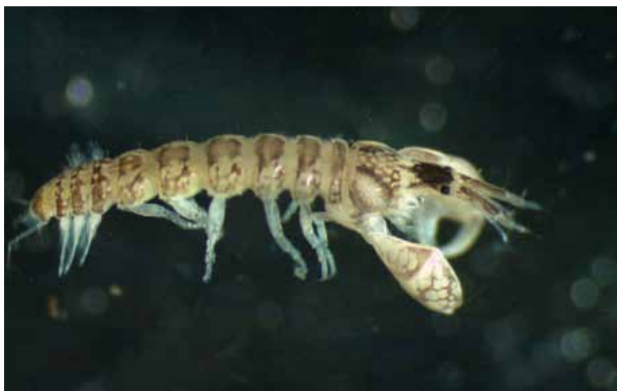
▼ Sinelobus stanfordi

HOLTHUIS 1956, SIEG 1980, HOLDICH & JONES 1983.