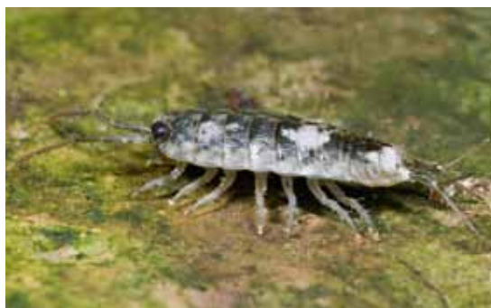
◀◀ Eluma caelatum