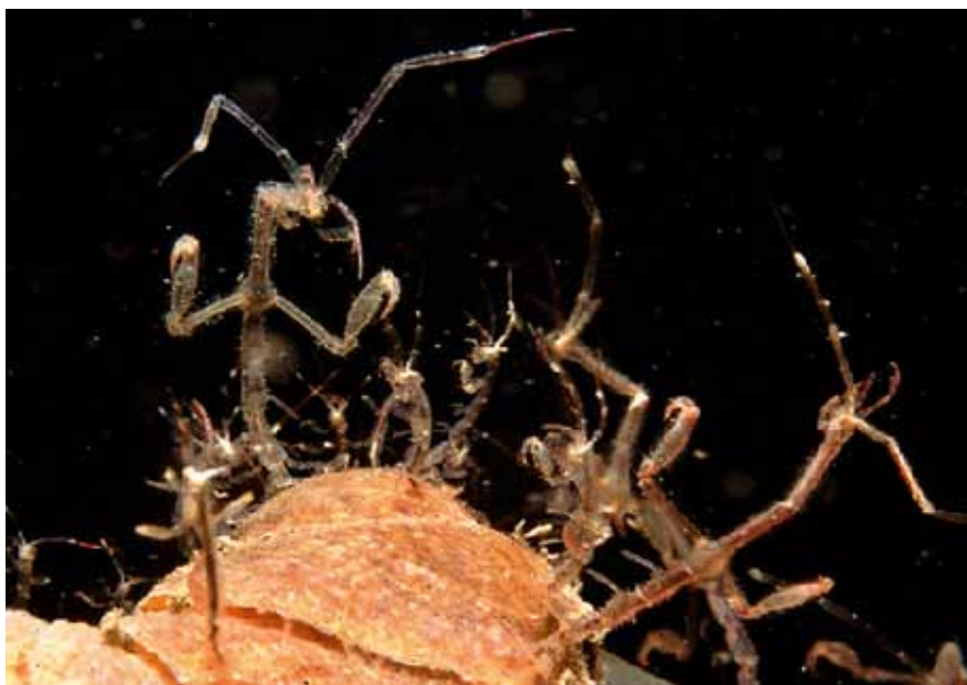
▲ Spookkreeftje Caprella mutica

schillende situaties aanpassen. Dit maakt dat ze tot de meest succesvolle invasieve diergroepen behoren. Vlokkreeftjes kunnen enorme dichtheden behalen, waardoor ze een zeer belangrijk voedselbron vormen voor veel, vooral jonge, vis.