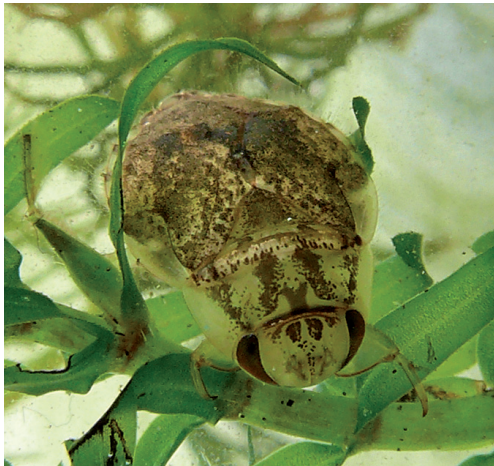
Figuur 1. Naucoris maculatus , imago. Loenen aan de Vecht.

1995). De soort is niet bekend uit Duitsland (Wachmann et al. 2006), maar is talrijk in de kustgebieden van Frankrijk (Poisson 1957). Uit Nederland waren tot voor kort alleen recente waarnemingen bekend uit het Nieuwkoopse plasseengebied (met name de Haeck), waar zich al decennia lang een grote populatie bevindt (Van Nieukerken 1972, collectie RMNH, eigen waarnemingen). Daarnaast zijn er oude meldingen