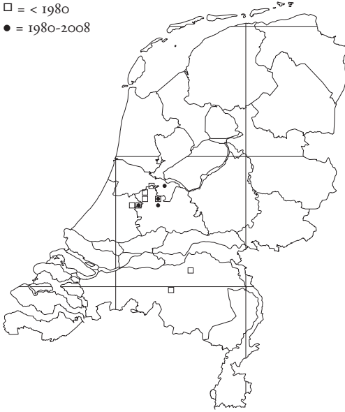
Figuur 3. Vindplaatsen van Naucoris maculatus in Nederland.