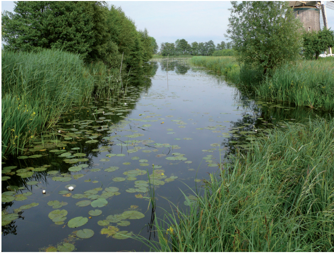
Figuur 4. Habitat van Naucoris maculatus in Loenen aan de Vecht.