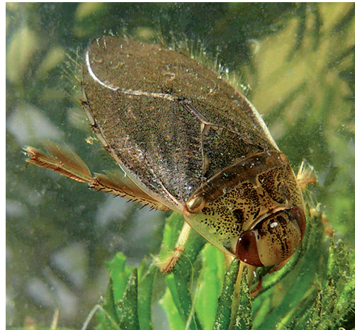
Figuur 2. Ilyocoris cimicoides , imago. Leiden, Cronesteyn.

Figure 1. Naucoris maculatus , adult. Loenen aan de Vecht.