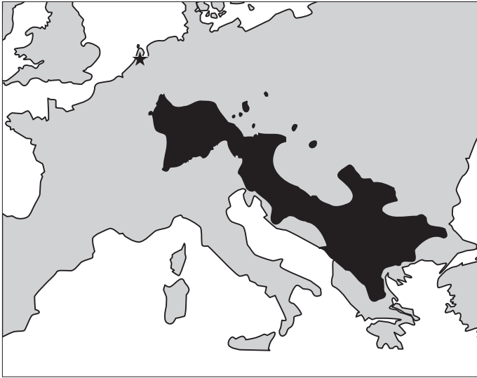
Figuur 2. Verspreiding van Austropotamobius torrentium in Europa (naar Machino & Féreder 2005). Het sterretje markeert de vindplaats in Nederland.

Figure 2. European distribution of Austropotamobius torrentium (after Machino & Féreder 2005). The asterisk indicates the Dutch locality.