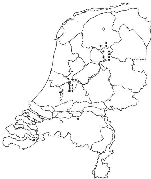
Verspreiding van de grote gerande oeverspin voor (cirkel) en vanaf 1980.