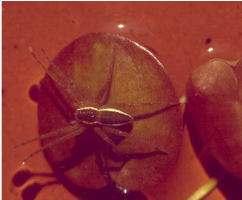
Jong exemplaar van de grote gerande oeverspin Dolomedes plantarius .