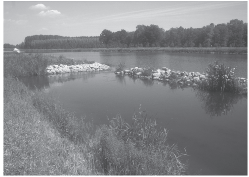
Figuur 2 Oever met damwand langs de Zuid-Willemsvaart. Figure 2 Sheet piling along the Zuid-Willemsvaart.