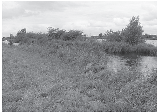
Figuur 4 Natuurvriendelijke oever langs het Zwarte Water. Figure 4 Nature friendly bank along the Zwarte Water.

soorten zijn voor de oevers en het open water van de rijkswateren beschreven (CUR 1999, Van der Molen et al. 2000, Lorenz 2001). Het voorkomen van deze soorten in de dataset is onderzocht. Vannote et al. (1980) beschrijven het 'river continuum concept', waarin het functioneren van een rivierecosysteem beschreven werd van de bron tot de monding. Dit deden zij onder andere aan de hand van de hydrologie, de energiestromen en de