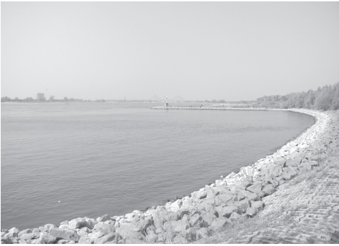
Figuur 1 Een verharde oever langs de Waal. Figure 1 A bank with armourstone along the river Waal.