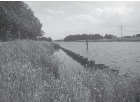
Figuur 3 Natuurvriendelijke oever langs het Twenthekanaal. Figure 3 Nature friendly bank along the Twenthekanaal.