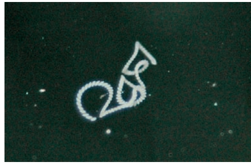
Figuur 4. Eipakket van Metriocnemus carmencitabertarum waarop de individuele eitjes zijn te onderscheiden (31.X.2011).