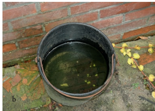
Figuur 1a. Habitat van Metriocnemus carmencitabertarum in Appingedam, b. Eiafzetplek. Figure 1a. Habitat of Metriocnemus carmencitabertarum in Appingedam, in the northeastern part of the Netherlands, b. Place of egg deposition.