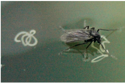
Figuur 3. Eiafzettend vrouwtje Metriocnemus carmencitabertarum (31.X.2011).