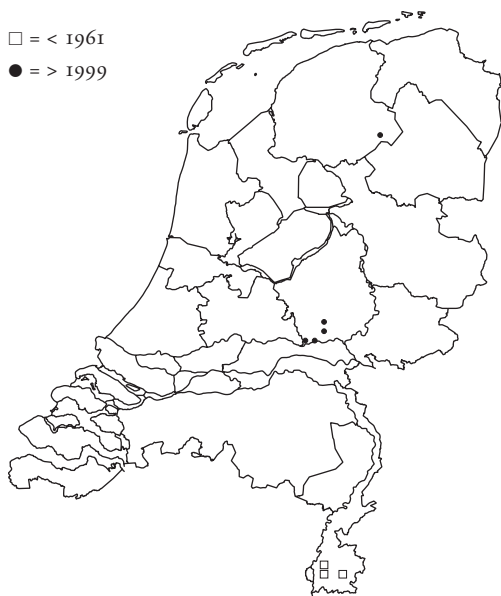
Figuur 2. Vindplaatsen van Harpalus signaticornis in Nederland. Figure 2. Records of Harpalus signaticornis in the Netherlands.

een groot verspreidingsgebied dat reikt van Oost-Siberië tot Centraal-Rusland en van Centraal-Azië (Kaukasus, Iran) via Turkije en de Balkan tot het Iberisch Schiereiland. In Europa lag het zwaartepunt van de verspreiding in het midden en zuiden, met steeds minder vindplaatsen richting het westen. In het noordwesten ontbrak de soort nagenoeg (Horion 1941, Müller-Motzfeld 2004, Turin 2000).