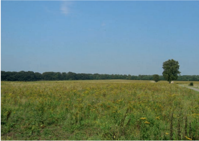
Figuur 3. Vanglocatie van Harpalus signaticornis bij natuurontwikkelingsterrein de Reijerscamp.