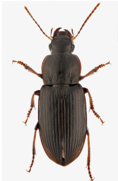
Figuur 1. Harpalus signaticornis , mannetje. Waarnemingen.

De soort staat in Nederland al lang te boek als uitermate zeldzaam. Tijdens het karteringsproject voor de eerste loopkeveratlas (Turin et al. 1977) vonden we in de collecties slechts drie Zuid-Limburgse exemplaren, respectievelijk uit 1937 (Berg, leg. F.T. Valck-Lucassen), 1958 (Colmond, leg. C.J.M. Berger) en 1960 (Wrakelberg, leg. P. Poot). Onlangs werd nog een collectie-exemplaar aangetroffen uit 1903 (Meerssen, leg. K.J.W. Kempers). Uit Vlaanderen was een gering aantal waarnemingen bekend, alle van vóór 1950 (Desender et al. 2008). Bij het werk voor de nieuwe atlas (Turin 2000) werden geen recente waarnemingen gevonden, waarop de soort het predicaat voor Nederland 'waarschijnlijk uitgestorven' kreeg. Volgens de oudere faunistische literatuur heeft H. signaticornis