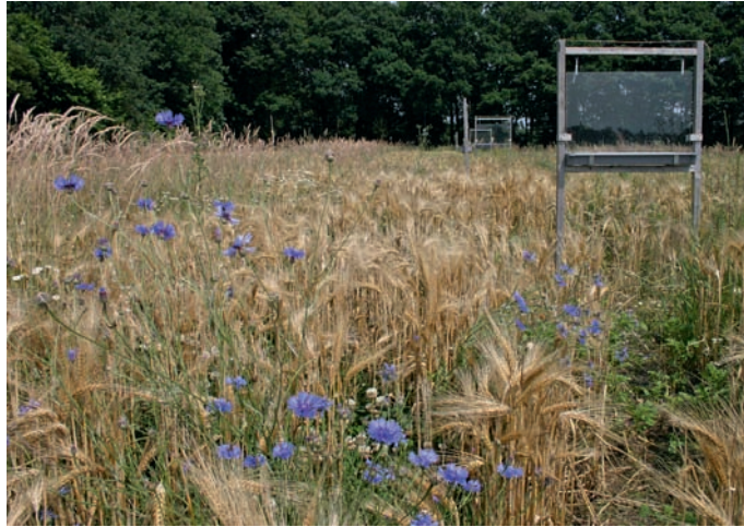
Figure 4. Locality where Harpalus signaticornis was found in Wageningen: an arable field with biologically grown crops.

verzameld. Een gelijktijdige bemonstering met 64 vallen van een akker op klei, op 4 km daarvan verwijderd, met dezelfde gewassen en hetzelfde beheer, leverde geen enkel exemplaar van H. signaticornis op (Stilma et al. 2008).