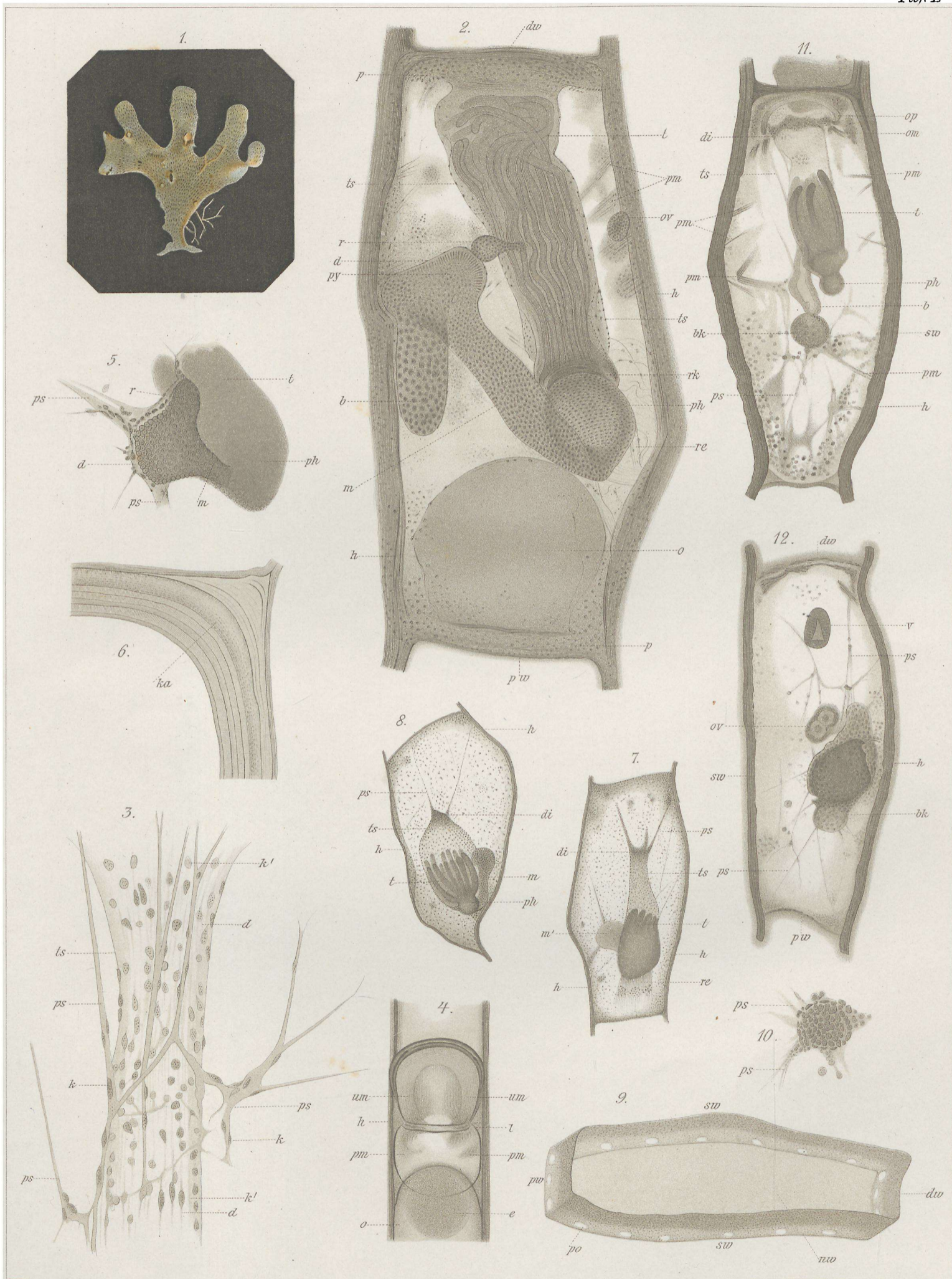
Fig. 1. Veder. Fig. 2-12. Vigelius del.