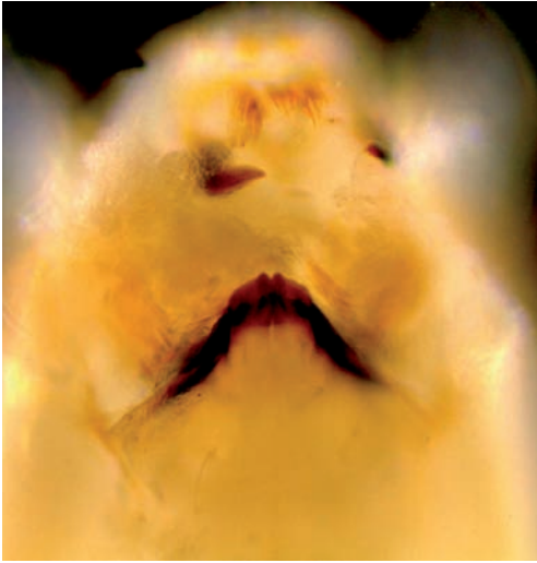
Figuur 1. Larve van P. schliezi . Onderzijde kop met kenmerkende geelbruine middentand.

Figure 1. Larva of P. schliezi . Ventral side of the head with typical yellow-brown medial tooth.