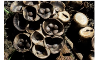
Bleek nestzwammetje Cyathus olla