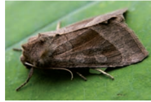
Groothoefbladboorder Hydraecia petasitis

Autographa gamma Gamma-uil Caradrina morpheus Morpheusstofuil Chilodes maritima Smalvleugelrietboorder Cosmia trapezina Hyena Diachrysa chrysitis Diarsia rubi Gewone breedvleugeluil Hadenia bicurris Gewone silene-uil Hoplodrina ambigua Hydraecia micacea Aardappelstengelboorder Hydraecia petasitis Groot-hoefbladboorder