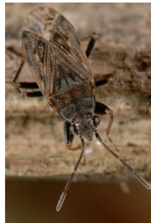
Peritrechus nubilus