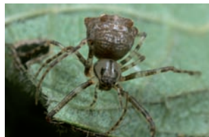
vierspitspinneneter Ero aphana

muscosa , de grootste springspin (Salticidae) in Nederland. Het is een niet echt zeldzame soort die ook rond huizen kan worden aangetroffen, tegenwoordig wordt de soort vaker waargenomen dan vroeger, met name in de stedelijke omgeving.