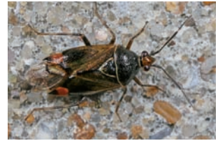
Deraeocoris flavilinea