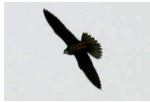
Slechtvalk Falco peregrinus

Falco peregrinus Slechtvalk Falco subbuteo Boomvalk Falco tinnunculus Torenvalk Pandionidae Pandion haliaetus Visarend