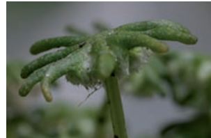
Parapluitjesmos Marchantia polymorpha