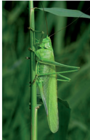
Grote groene sabelsprinkhaan Tettigonia viridissima

Conocephalus dorsalis Gewoon spitskopje Meconema meridionale Zuidelijke boomsprinkhaan Tettigonia viridissima Grote groene sabelsprinkhaan