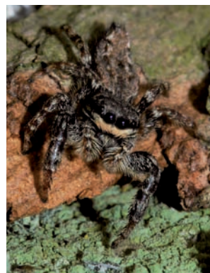
Schorsmarpissa Marpissa muscosa