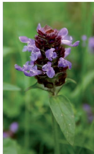
Gewone brunel Prunella vulgaris

Glechoma hederacea Hondsdraf Lamium album Witte dovenetel Lamium amplexicaule Hoenderbeet Lamium purpureum Paarse dovenetel Lycopus europaeus Wolfspoot Mentha aquatica Watermunt Prunella vulgaris Gewone brunel