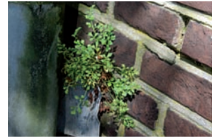
Muurvaren Asplenium ruta-muraria

Urtica dioica Grote brandnetel Urtica urens Kleine brandnetel Violales Violaceae Viola riviniana Bleeksporig bosviooltje Pinopsida J. Kortselius. Pinales Taxaceae Taxus baccata Taxus Tracheophyta H. Adema. Pteropsida Aspleniaceae Asplenium ruta-muraria Muurvaren Azollaceae Azolla filiculoides Grote