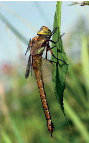
Vroege glazenmaker Aeshna isocles

Aeshna mixta Paardenbijter Anax imperator Grote keizerlibel