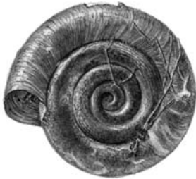
Platte schijfhoren Anisus vorticulus Tekening: G.A. Peeters

Anisus vortex Draaikolkschijfhoren Anisus vorticulus Platte schijfhoren