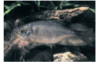
Bittervoorn Rhodeus amarus