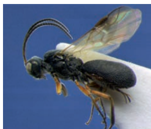
Schizoprymnus pallidipennis

Cephalidae Calameuta filiformis Cephus cultratus Chrysididae Chrysis angustula Chrysis ignita Cleptes semiauratus Crabronidae Crabro peltarius Kleine zeefwesp Crossocerus annulipes Crossocerus congener Crossocerus elongatulus Crossocerus varus Ectemnius cavifrons Ectemnius cephalotes Ectemnius continuus Lestiphorus bicinctus Oxybelus bipunctatus Passaloecus gracilis Philanthus triangulum Bijenwolf Psenulus concolor Rhopalum coarctatum Rhopalum gracile Trypoxylon attenuatum Trypoxylon figulus Cynipidae Andricus kollari gal op Quercus robur Andricus quercuscalicis Formicidae Lasius flavus Gele weidemier Lasius fuliginosus Glanzende houtmier Lasius niger Wegmier Lasius psammophilus Buntgrasmier