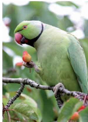
Halsbandparkiet Psittacula krameri

Anthus pratensis Graspieper Motacilla alba Witte kwikstaart Motacilla flava Gele kwikstaart