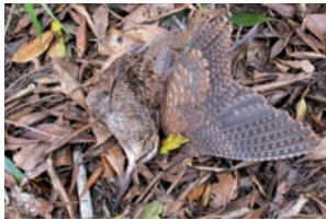
Houtsnip Scolopax rusticola

Larus argentatus Zilvermeeuw Larus canus Stormmeeuw Larus fuscus Kleine mantelmeeuw Larus ridibundus Kokmeeuw Sterna hirundo Visdief Scolopacidae Gallinago gallinago Watersnip Scolopax rusticola Houtsnip