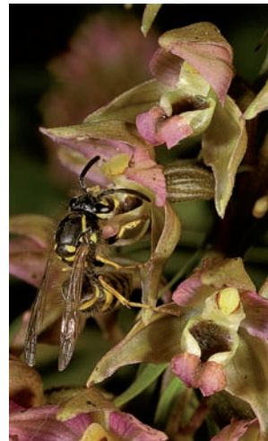
Brede wespenorchis Epipactis helleborine

Epipactis helleborine Brede wespenorchis