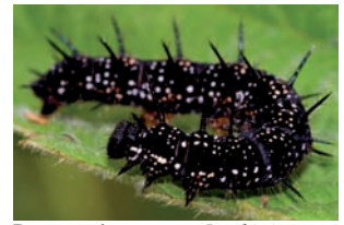
Rups van daggauwoog Inachis io

Hypena proboscidalis Bruine snuituil Lacanobia oleracea Groente-uil Luperina testacea Gewone grasuil Macdunnoughia confusa Mamestra brassicae Kooluil Mesapamea didyma Weidehalmuiltje Mesapamea secalis Halmrupsvlinder Mesologia furuncula Mythimna l-album Witte-l-uil Mythimna straminea Spitsvleugelgrasuil Naenia typica Splinterstreep Noctua comes Volgeling Noctua interjecta Kleine huismoeder Noctua janthe Open-breedbandhuismoeder Noctua janthina Kleine breedbandhuismoeder Noctua pronuba Huismoeder Oligia strigilis Orthosia incerta Variabele voorjaarsuil Paradrina clavipalpis Huisuil Parastichtis ypsilon Phlogophora meticulosa Rhizodra lutosus Herfst-rietboorder Rivula sericealis Stro-uiltje Schrankia costaeistrigalis Gepijlde micro-uil Xanthia ocellaris Populierengouduil Xestia c-nigrum Zwarte-c-uil Xestia xanthographa Vierkantvlekuil Notodontidae Clostera curtula Nymphalidae Aglais urticae Kleine vos Inachis io Daggauwoog Maniola jurtina Bruin zandoogje Pararge aegeria Bont zandoogje Vanessa atalanta Atalanta Oecophoridae Crassa unitella Hofmannophila pseudospretella