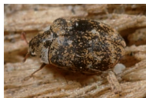
Museumtorretje Anthrenus museorum

Hydroglyphus geminus Hydroporus cf. palustris Hygrotus versicolor Hyphydrus ovatus Eirond watertorretje Elateridae Adrastus pallens Agriotes lineatus Gestreepte kniptor Athous haemorrhoidalis Roodaarskniptor Hemicroperidius niger Haliplidae Haliplus fluviatilis Haliplus immaculatus Haliplus lineolatus Histeridae Kissister minimus Hydraenidae Ochthebius bicolor Hydrophilidae Anacaena bipustulata Anacaena globulus Anacaena limbata Cercyon marinus Chaetarthria seminulum Oeverkogeltje Enochrus testaceus Helophorus aequalis Helophorus brevipalpis Helophorus cf. minutus Helophorus obscurus Laccobius bipunctatus Kateretidae Kateretes pedicularis Latridiidae Corticaria fulva Corticaria similata Cortinicara gibbosa Enicmus transversus Leiodidae Leiodes calcarata Leiodes cf. rufipennis Limnichidae Limnichus pygmaeus Malachiidae Cordylepherus viridis Mordellidae Mordellistena acuticollis *Mordellistena f.n.sp. Mordellistena neuwaldeggiana Nitidulidae Meligethes aeneus Koolzaadglanskevertje Meligethes carinulatus Meligethes flavimanus Meligethes morosus Meligethes ovatus Meligethes symphyti Smeerwortelglanskever Noteridae Noterus clavicornis Diksprietwaterroofkever Noterus crassicornis Diksprietzwemkevertje Oedemeridae