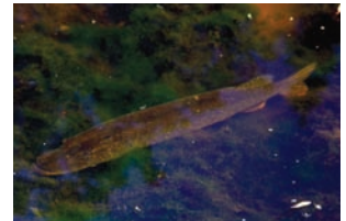
Snoek Esox lucius