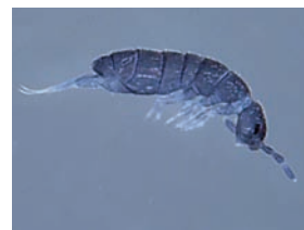
Desoria trispinata