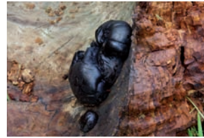
Kogelhoutskoolzwam Daldinia concentrica