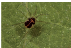
Unionicola crassipes