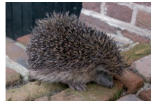
Egel Erinaceus europaeus