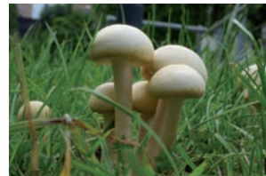
Barstende leemhoed Agrocybe dura