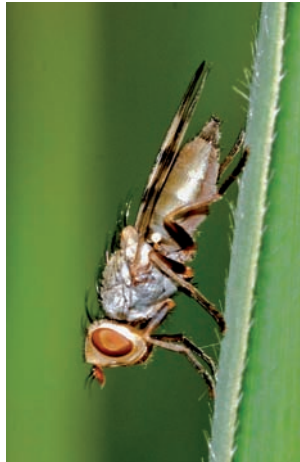
Melieria melissa

platvoetje Platycheirus clypeatus Gewoon platvoetje Platycheirus peltatus Scheefvlekplatvoetje Platycheirus scutatus Schaduwplatvoetje Pyrophaena granditarsa Klompvoetje Scaeva pyrastris Witte halvemaan- zweefvlieg Sphaerophoria rueppelli Kleine langlijf Sphaerophoria scripta Grote langlijf Sphaerophoria taeniata Gras- langlijf Syrirta pipiens Menuetzweefvlieg Syrphus ribesii Bessenband- zweefvlieg Syrphus torvus Bosbandzweef- vlieg Syrphus vitripennis Kleine band- zweefvlieg Tropidia scita Moeraszweefvlieg Volucella pellucens Witte reus Volucella zonaria Stadsreus Xanthogramma pedissequum Gewone citroenzweefvlieg Xylota segnis Gewone rode bladloper Tabanidae Chrysops relictus Gewone goudoogdaas Haematopota pluvialis Regendaas Tachinidae Eriothrix rufomaculata Exorista rustica Phryxe heraclei Phryxe vulgaris Vibrissina turrita Voria ruralis Tephritidae Acidia cognata Anomia purmunda Campiglossa absinthii Campiglossa misella Dioxyna bidentis Ensina sonchi Euleia heraclei ook gevonden als mijn op Heracleum sphondylium Oxya flavipennis Oxya parietina Philophylla caesio Sphenella marginata Tephritis formosa Tephritis hyoscyami Trupanea stellata Trypeta artemisiae ook gevonden als mijnen met larven op Artemisia vulgaris Trypeta zoe Urophora stylata Speerdistelboorvlieg Therevidae Thereva cinifera Thereva fulva Thereva nobilitata Uliidiidae Melieria omissa Ephemeroptera Haften E.J. van Nieuwerkerken, C. van den Berg. Baetiidae Cloeon dipterum Caenidae Caenis robusta