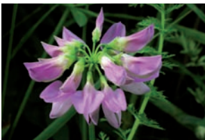
Bont kroonkruid Securigera varia

Lathyrus pratensis Veldlathyrus Lotus corniculatus Gewone rolklaver en rechte rolklaver Medicago lupulina Hopklaver Melilotus albus Witte honingklaver Melilotus altissimus Goudgele honingklaver Securigera varia Bont kroonkruid