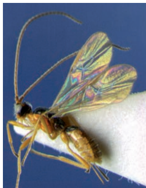
Rhyssipolis sp. nov.

Polemochartus melas *Protapanteles pinicola *Rhyssipolis spec. nov. *Schizoprymnus pallidipennis *Schizoprymnus tuberosus Trioxyx compressicornis