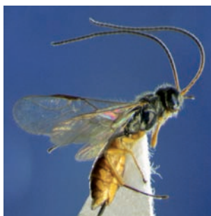
Chorebus sera

Bombus pascuorum Akkerhommel Bombus pratorum Weidehommel Bombus terrestris Aardhommel Colletes daviesanus Wormkruidbij Halictus rubicundus Roodpotige groefbij Hylaeus communis Gewone maskerbij Hylaeus hyalinatus Tuinmaskerbij Lasioglossum calceatum Gewone geurgroefbij Lasioglossum leucozonium Matte bandgroefbij Lasioglossum morio Langkopsmaragdgroefbij Lasioglossum sexstrigatum Gewone franjegroefbij Megachile centuncularis Tuinbladsnijder Megachile willughbiella Grote bladsnijder Osmia rufa Rosse metselbij Braconidae Aphidius ervi Aphidius hieraciorum Aphidius sonchi Aphidius urticae Ascogaster abdominator Ascogaster quadridentata Bracon delibator Chelonus corvulus *Chorebus fordi Chorebus glaber *Chorebus maculigastrus Chorebus resa Chorebus senilis *Chorebus sera