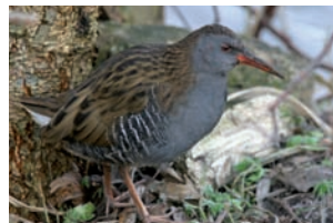
Waterral Rallus aquaticus

Fulica atra Meerkoet Gallinula chloropus Waterhoen Rallus aquaticus Waterral