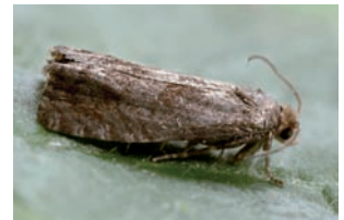
Epiblema turbidana

Tortricidae Acleris forsskalleana Acleris hastiana Aleimma loeflingiana Archips podana Grote appelbladroller Bactra lancealana Celypha lacunana Brandnetelbladroller Celypha striana Clepsis consimilana Clepsis spectrana Koolbladroller Cochyliis atricapitana Cydia splendana Okkernootmot Dichrorampha flavidorsana Dichrorampha plumbana Dichrorampha simpliciana Epiblema foenella Epiblema turbidana