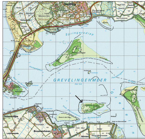
Figuur 5. Ligging van de Stammersplaat in de Grevelingen. Topografische ondergrond: copyright © 2005 Dienst voor het Kadaster en de openbare registers, Apeldoorn.

Het is onduidelijk welke waardplant deze soort heeft. Vermoedelijk is het net als bij veel andere Tephritis -soorten een distel. Merz (1994) meldt dat de soort waarschijnlijk leeft in bloemhoofdjes van Cirsium canum . Hij geeft echter geen bron of melding van eigen kweek. Kütük & Özgür (2003)