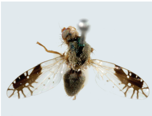
Figuur 1. Het mannetje van Tephritis acanthiophilopsis verzameld op de Stampersplaat op 14 juni 2006.

In 2006 heeft Kees de Kraker op de Stampersplaat geïnventariseerd met behulp van een malaiseval. De Stampersplaat is een van de zandplaten in de Grevelingen. Er zijn in totaal 12 soorten boorvliegen gevangen (tabel 1), waaronder op 14 juni één mannetje van Tephritis acanthiophilopsis Hering, 1938 (fig. 1). Dit is de eerste waarneming voor Nederland en tevens voor Noordwest-Europa. De dichtstbijzijnde bekende vindplaats ligt in Slowakije (Dirlbek 1996).