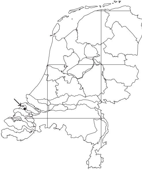
Figuur 4. Vindplaats van Tephritis acanthiophilopsis in Nederland.

Figure 4. Site where Tephritis acanthiophilopsis was found in the Netherlands.