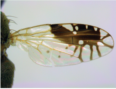
Figuur 2. Vleugel van Tephritis acanthiophilopsis . De subapicale band heeft dezelfde kleur als de rest van de vleugeltekening.

Figure 2. Wing of Tephritis acanthiophilopsis . The subapical band is of the same colour as the rest of the wingpattern.