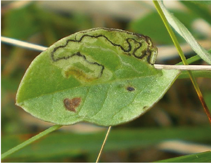
1. Stigmella freyella ; bladmine met rups op zeevinde ( Convolvulus soldanella ). 1. Stigmella freyella ; tenanted leafmine on sea bindweed ( Convolvulus soldanella ).