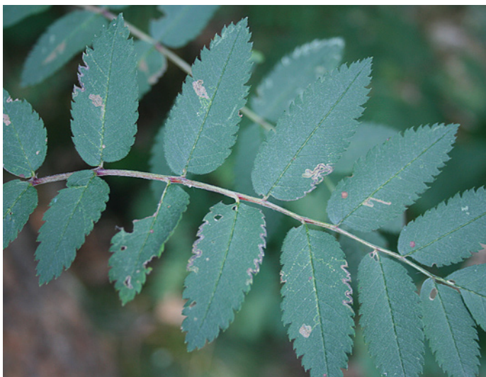
3. Stigmella magdalanae ; tenminste elf mijnen op lijsterbes ( Sorbus aucuparia ) in Dwingeloo (DR). 3. Stigmella magdalanae ; at least eleven mines on rowan ( Sorbus aucuparia ) in Dwingeloo (Drenthe).

(Frey, 1857) uit te breiden. Op genoemde plaatsen komen beide soorten samen op dezelfde bomen voor.