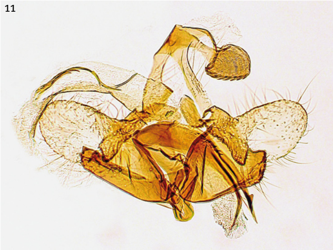
10-11. Coleophora boreella . 10 Mannetje. 11 Mannelijk genitaal, preparaat GU 2393 Stübner. 10-11. Coleophora boreella . 10 Male. 11 Male genitalia, slide GU 2393 Stübner.