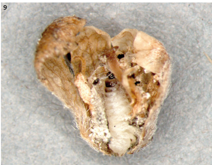
7-9. Nemophora cf. minimella ; levenswijze op blauwe knoop ( Succisa pratensis ). 7 Jonge rupsen in wandelende bloemetjes, 8 Hoofdje van blauwe knoop met diverse zakjes met zichtbaar spinsel, 9 Rups in opengemaakt beginnend zakje, gemaakt uit bloem.

7-9. Nemophora cf. minimella , biology on devil's-bit scabious ( Succisa pratensis ). 7 Young caterpillars in walking flowers, 8 Flower head with various cases with spinning visible, 9 Caterpillar in opened early case, prepared from flower.