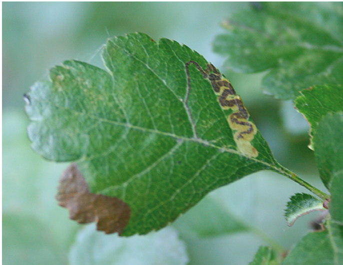
2. Stigmella crataegella ; lege mijn op tweestijlige meidoorn ( Crataegus laevigata ), Winterswijk (GE). 2. Stigmella crataegella ; vacated mine on English hawthorn ( Crataegus laevigata ), Winterswijk (Gelderland).