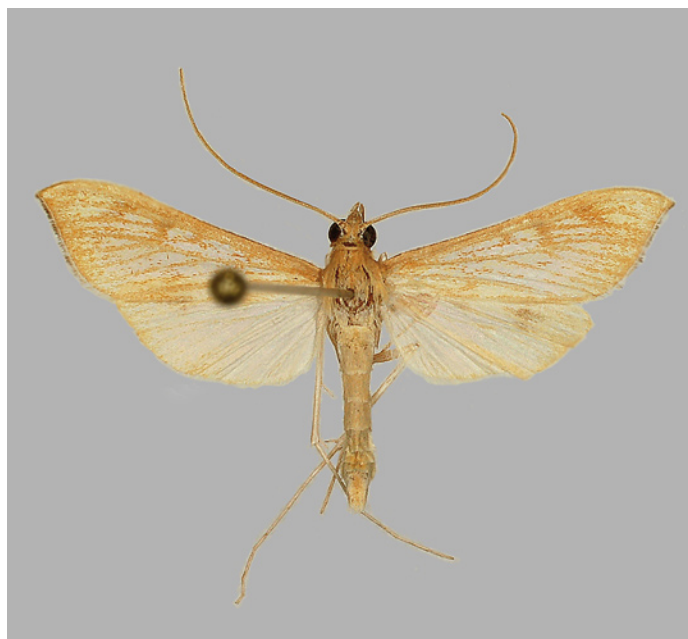
12. Antigastra catalaunalis . Mannetje, Retranchement ( ZE ), 29.ix.2006, collectie Zoologisch Museum Amsterdam. 12. Antigastra catalaunalis . Male, Retranchement (Zeeland), 29.ix.2006, collection Zoological Museum Amsterdam.

OV Zuidloo, 25.ix.2006, HG – ZE Retranchement, 18 en 29.ix.2006, AA ; St. Kruis, De Plate, 16.ix.2006, HBL & PS ; Kruijningen, 27.ix.2006, FL . Deze aanwinst voor onze fauna werd het eerst gevangen in Zeeuws Vlaanderen, in Sint Kruis, maar later ook op andere plaatsen daar en ook in het oosten van ons land, alle vondsten in september. Ook in België werden in september negen exemplaren verspreid door het land waargenomen (De Prins & Veraghtert 2006) en op een groot aantal plaatsen in Zuid-Engeland (Prichard 2008, Wheeler 2008 en diverse andere websites). De vlinder is goed te herkennen, lijkt iets op Nascia ciliialis (Hübner, 1796), maar heeft smallere voorvleugels. Antigastra catalaunalis is een bijna wereldwijd voorkomende tropische vlinder, bekend als de sesame leafroller of sesame podmoth. De rups is vooral bekend als plaag op sesamsoorten ( Sesamum spp., fam. Pedaliaceae) maar leeft ook op diverse andere kruiden (Robinson et al. 2008). In Zuid-Europa komt hij verspreid voor en af en toe dringen migranten door tot in Midden Europa. Zo wordt de vlinder vermeld uit Tsjechië, Hongarije en Zwitserland. Het dier is zelfs in Denemarken en in 2004 in Zweden aangetroffen (Gustafsson 2003, Nuss et al. 2004). De waarnemingen van deze soort in het fameuze trekkersjaar 2006 in België, Engeland en Nederland wijzen op een plotselinge migratiegolf in september vanuit Zuid-Europa (zie ook Schaffers, dit nummer).