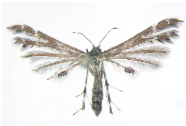
Figuur 7. Oxyptilus parvidactyla , vrouwtje, Oostermeer.

Oxyptilus parvidactyla , 4 female in her habitat, 5 the wooded bank and 6 the vegetation of Hieracium pilosella where the moth was flying.