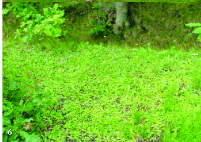
Figuren 4-6. Oxyptilus parvidactyla , 4 vrouwtje in biotoop, 5 de houtwal en 6 de vegetatie van muizenoor ( Hieracium pilosella ) waar deze vloog. Foto's: G. Tuinstra

Oxyptilus parvidactyla , 4 female in her habitat, 5 the wooded bank and 6 the vegetation of Hieracium pilosella where the moth was flying.