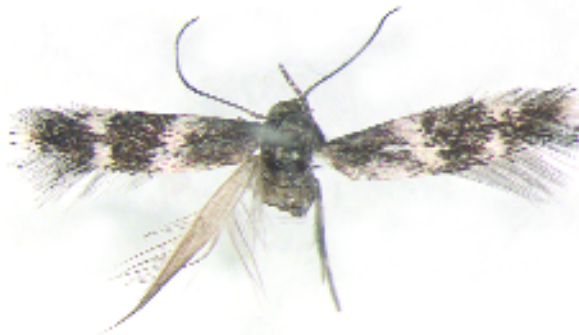
Figuur 2. Elachista kilmunella , vrouwtje, Hoog-Keppel.

Dit is het vierde exemplaar voor Nederland. De soort is als nieuw voor ons land gemeld door Kuchlein (2004) op grond van drie exemplaren uit het Aamsveen, Twente. Nieuw voor Gelderland.