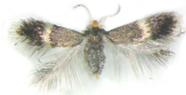
Figuur 1. Stigmella carpinella , vrouwtje, Wijlre. Let op de lichte antennes! Stigmella carpinella , female, Wijlre, Limburg. Note the pale antennae!

Stigmella carpinella was tot nu toe alleen met zekerheid uit Zuid-Limburg bekend. Wel geeft de verspreidingskaart in Kuchlein & Donner (1993) twee vindplaatsen erbuiten (ZH, UT), met de opmerking dat deze vondsten kritisch bekeken moeten worden. Materiaal van die plekken en van Overveen (NH) staat in de collectie RMNH: 1 ♂ uit Rotterdam, 24.v.1864, Snellen (Graaf & Snellen 1879) blijkt een verkeerd gedetermineerde Stigmella obliquella (Heinemann, 1862) en in de collectie Bentinck staan 1 ♂ en 2 ♀ uit Amerongen (Bentinck 1959) en 1 ♀ uit Overveen (Bentinck 1932), die behoren tot respectievelijk Stigmella tityrella (Stainton, 1854) (♂), S. obliquella (2 ♀) en S. salicis (Stainton 1854) (1 ♀). Omdat de gegevens van de Limburgse exemplaren behalve op genoemd kaartje nooit gepubliceerd zijn, geven we hier alle ons bekende vondsten. De mijnen van S. carpinella op haagbeuk lijken sterk op die van S. floslactella (Haworth, 1828) die meestal op hazelaar ( Corylus avellana ) mineert. De mijn is makkelijk te onderscheiden van die van de gewonere S. microtheriella , die op beide bomen leeft. De vlinder lijkt opper-