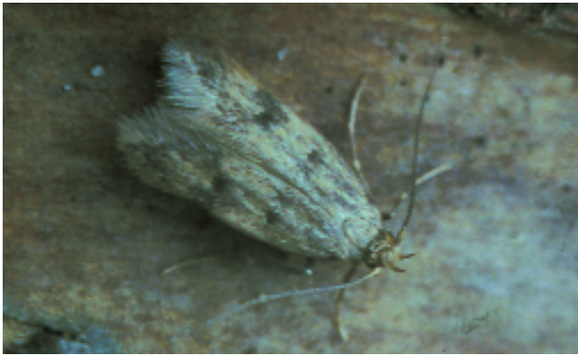
Figuur 3. Borkausenia nefrax , vlinder op muur in huis, Naaldwijk. Borkausenia nefrax , moth on wall in house, Naaldwijk, Zuid-Holland.

ZH: Naaldwijk, 31.iii.13.viii.1999, 10.viii.2003, 29.ix, 14.x.2004, JSS. Alle exemplaren, op die van 10.viii.2003 na, werden binnenshuis verzameld aan de rand van het centrum van Naaldwijk. Nu werd voor het eerst een exemplaar van Borkhausenia nefrax buitenshuis op het licht van een buitenlamp gevangen, maar aangezien de vlinder van exact dezelfde vindplaats is, zal deze ongetwijfeld uit dit huis 'ontsnapt' zijn. Tot nu toe is deze soort alleen in het westen van ons land gevonden.